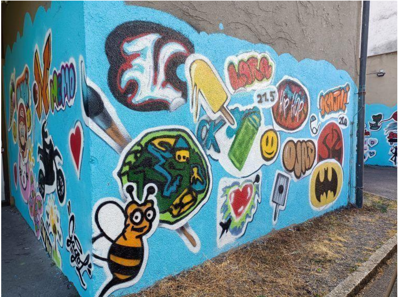
Das Resultat der drei Tage Arbeit kann sich sehen lassen. OFFENE JUGENDARBEIT