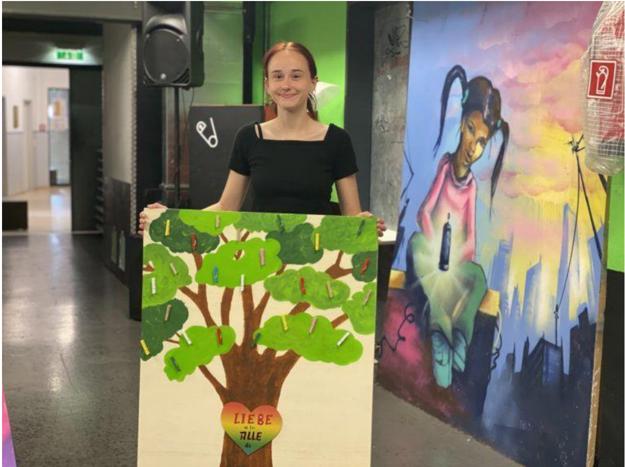
Das Plakat, auf dem die Bilder von der Fotobox gehängt werden können.