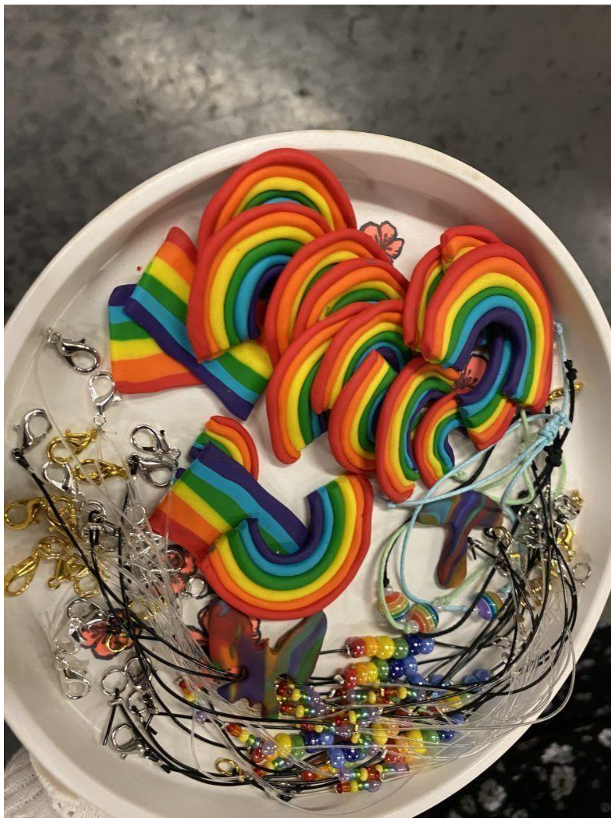
Sie haben selbst die Broschen und Armbänder gemacht.