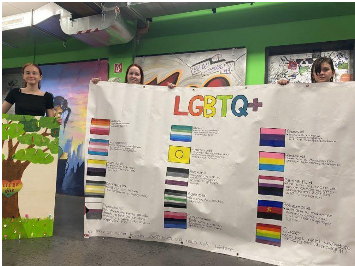
Die Mädchen freuen sich alle auf Freitag.