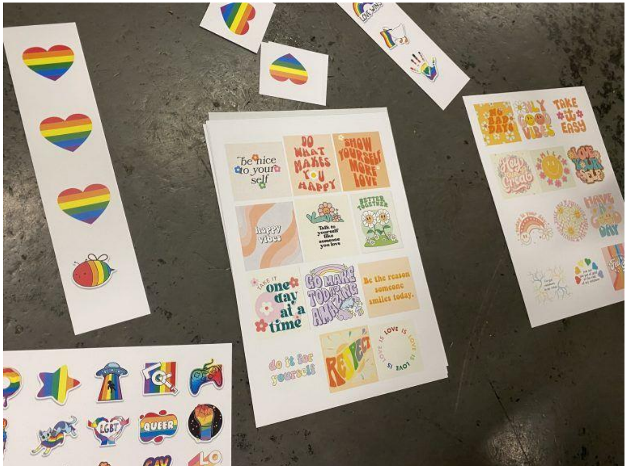
Die Vorlagen für die Buttons. VN/PEM

Auch eine Fotobox wird es an dem Abend geben. Die Erinnerungen können die Gäste für sich behalten oder ihr Kommen auf einem Plakat, das die Mädchen gemacht haben, mit der Aufschrift "Liebe ist für alle da" verewigen. "Für mich war es klar, dass ich hierbei mitwirken möchte. Nicht nur, weil ich gerne dekoriere, sondern weil ich das Thema wichtig finde. Es soll nach außen gebracht und die Vielfalt gezeigt werden", sagt auch Selina Pflieger.