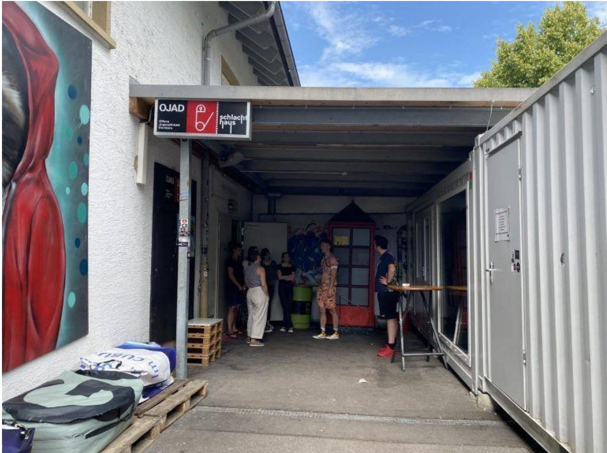
Die Fab-Party findet am Freitag im Schlachthauscafé der OJA Dornbirn statt.

“Ich bin bald 40, das heißt ich gehöre zu der älteren Generation. Im Team haben wir geredet und kamen dann auf die Idee, dass wir für die jüngere Generation was machen müssen”, sagt Wiehl. “Ich gestalte gerne und würde diese Staffel oder Fackel an die Jüngeren übergeben.”